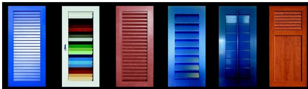
LAFERY VIANTE LAFAZO LAFETTA VIELA MIXTE