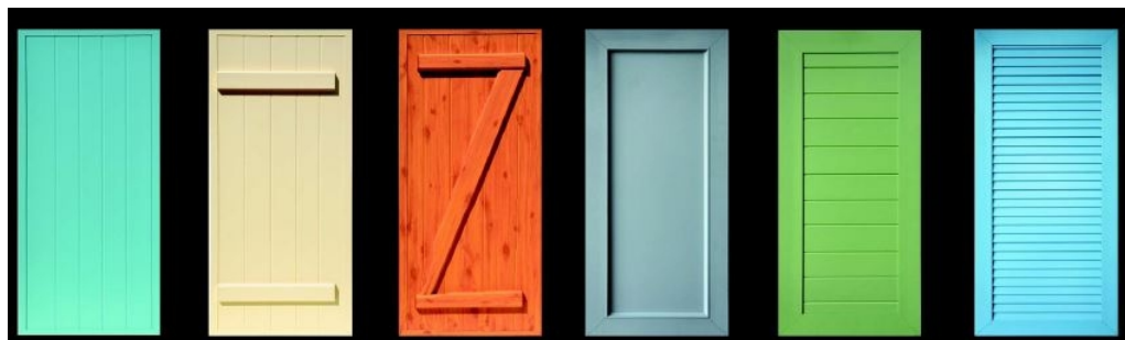
ISOLA ISOLA-B ISOLA-Z BLUMIA FRENESIE TAPION